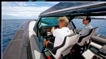
Goldfish 46 Bullet Séquence émotion