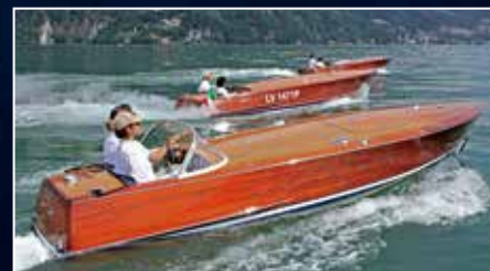
Colombo Ex-fan des sixties