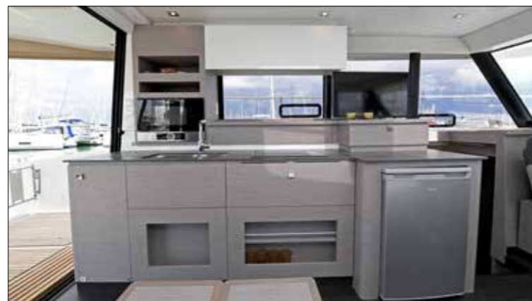
Le 40.S reconcentre tous les éléments de cuisine sur le côté tribord, comme le réfrigérateur. Un autre frigo (option) est logé dans la coursive bâbord.

À l'intérieur, toit ouvrant et vitrages accentuent l'effet de transparence. La grande table du MY 37 a été remplacée par une table basse moins encombrante.