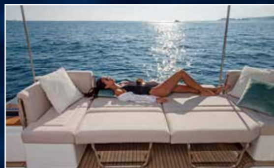
Plus cosy que celui du MY 37, le sofa dispose de dossiers rabattables pour former un bain de soleil.