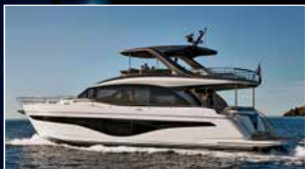
Princess Y72 Le nouvel étalon

◀ Fountaine Pajot MY4.S Sans fly et sans reproche