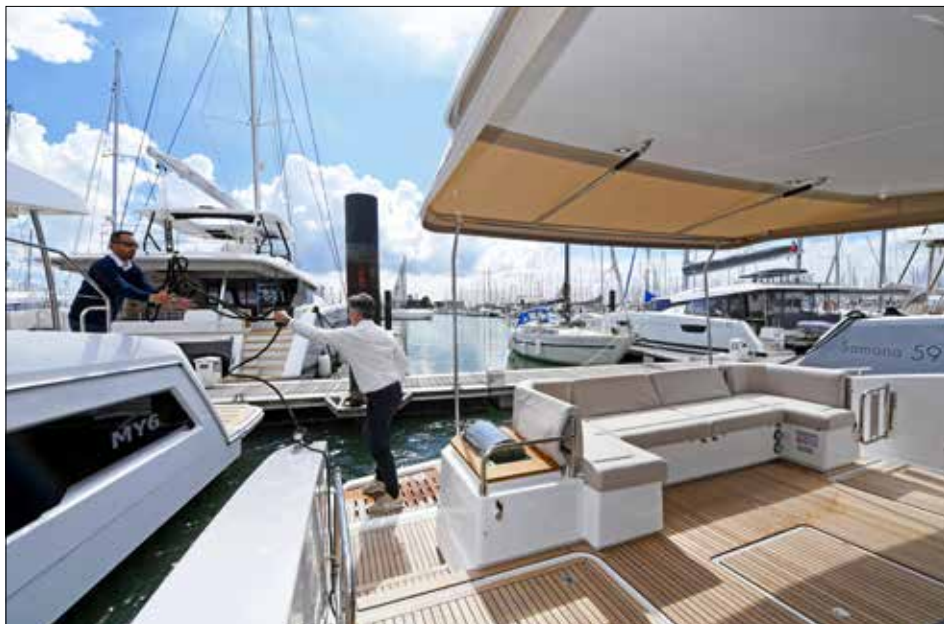
La largeur du catamaran ne doit pas effrayer le pilote lors des manœuvres de port qui s'effectuent sans stress.

► une motorisation plus sage (avec 2 x 150 ch Yanmar) qui devrait frôler les 18 nœuds maxi. Avec le cata, le capitaine navigue comme il l'entend : vitesse soutenue de 17-18 nœuds sur une longue distance ou régime basse consommation sous les 10 nœuds en brûlant moins de deux litres au mille.