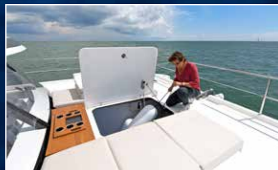
Toujours aussi pratique, la soute avant permet de ranger les défenses une fois le coussin central retiré.