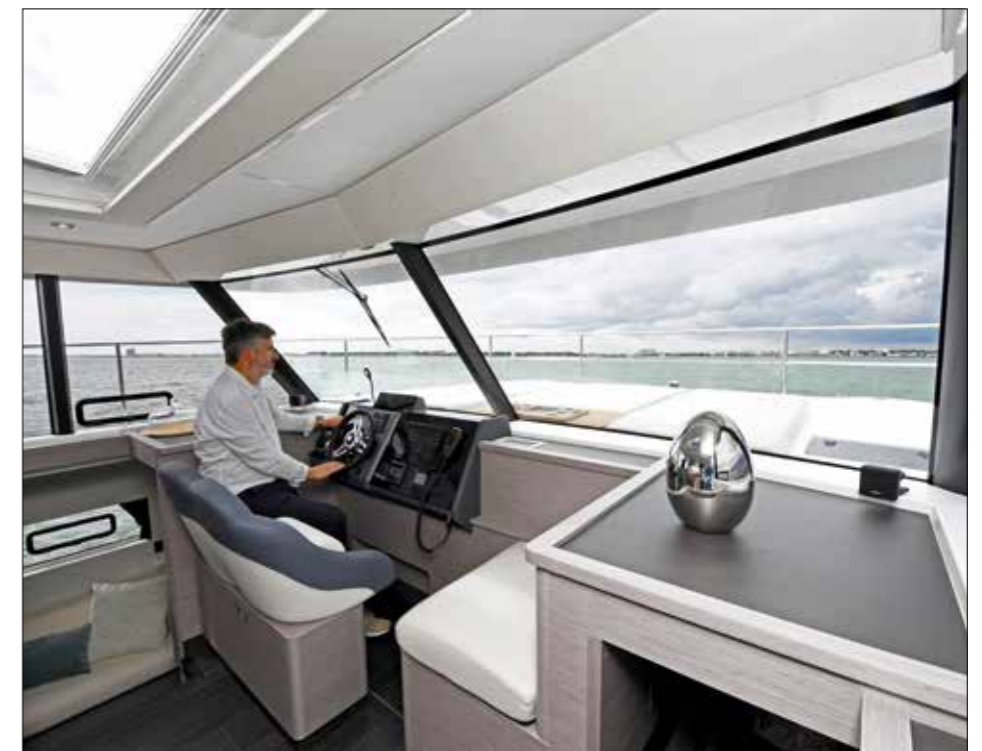
Très proche du pare-brise, le poste de barre dispose de deux fauteuils pilote et copilote et d'une courte banquette pour permettre à l'équipage de vivre la navigation aux premières loges.