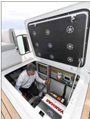
Logés dans des compartiments isolés, les blocs moteurs sont particulièrement accessibles.